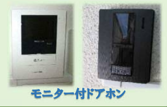
モニター付ドアホン