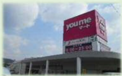
ゆめマート曾根店